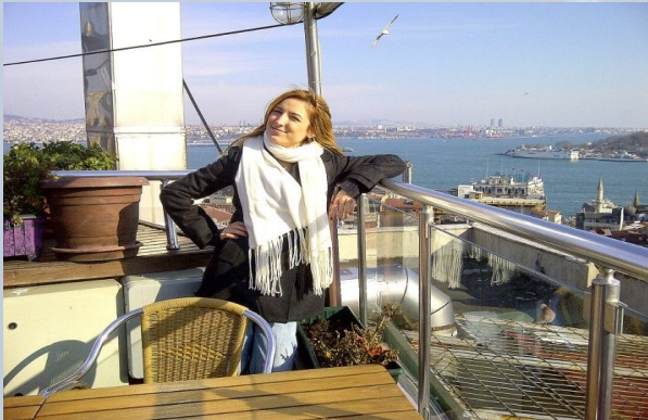
The picture taken at Galata Konak Cafe at Karaköy

Eray: Çok kalabalık. Az insan çok huzur.